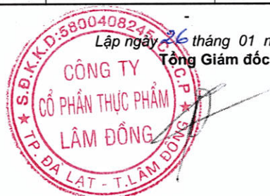
Đỗ Thành Trung