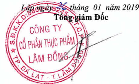
Đỗ Thành Trung